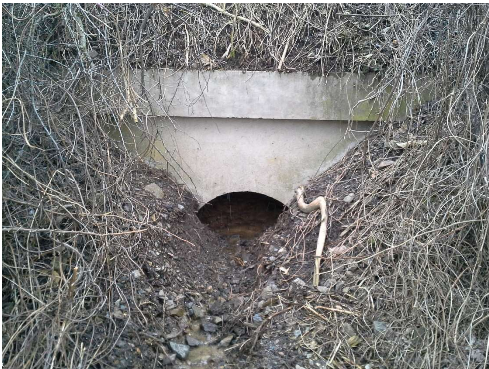
Foto 3: Pohled na výtokové čelo propustky s troubou zanesenou sedimenty